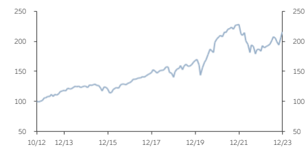
■ AM類 (美元) 收息股份