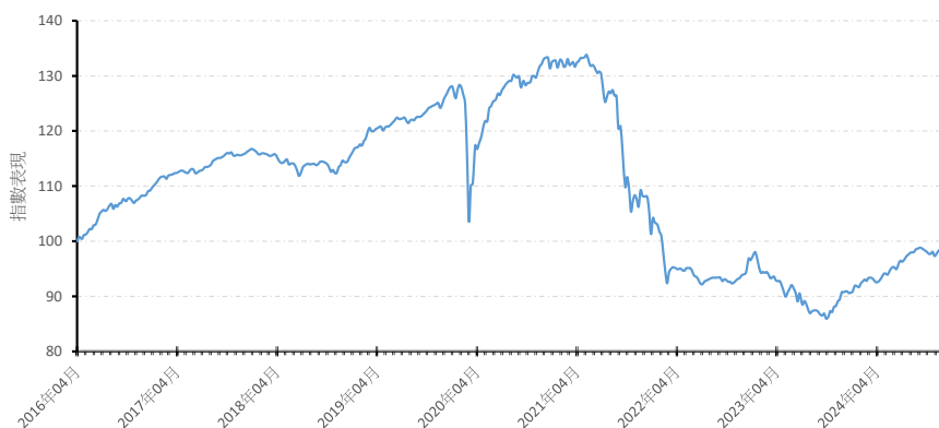
A 美元 (分派)