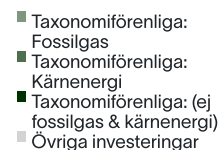
2. Taxonomiförenlighet hos investeringar, exklusive statliga obligationer*