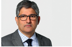
Hemant Baijal New York Gère le fonds depuis août 2019