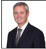
Jeremy A. Smith Depuis Nov 22 Threadneedle Man. Lux. S.A. Columbia Threadneedle (Lux) I multiples:

Société de gestion: Threadneedle Man. Lux. S.A. Fonds à compartiments multiples: Columbia Threadneedle (Lux) I multiples: Catégorie SFDR: Article 6 Date de lancement: 05/10/16 Indice: FTSE All-Share Groupe de pairs: - Devise du Compartiment: GBP Domicile du Fonds: Luxembourg Actif net: £247,6m N° de titres: 41 Prix: 15,6592