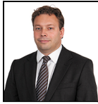
Chris Kinder Depuis Sept 14 Threadneedle Man. Lux. S.A.

Société de gestion: Threadneedle Man. Lux. S.A. Date de lancement: 06/12/11 Indice: FTSE All-Share Groupe de pairs: - Devise du Compartiment: GBP Domicile du Fonds: Luxembourg Actif net: £359,6m N° de titres: 52 Prix: 29,3469