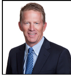
Guy Pope Depuis Oct 11

Société de gestion: Threadneedle Ma. Lux. S.A. Fonds à compartiments multiples: Columbia Threadneedle (Lux) I Catégorie SFDR: Article 8 Date de lancement: 12/10/11 Indice: S&P 500 Groupe de pairs: - Devise du Compartiment: USD Domicile du Fonds: Luxembourg Actif net: €501,7m N° de titres: 76 Prix: 63,4510