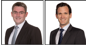
Alasdair Ross Depuis Mars 18 Ryan Staszewski Depuis Mars 18 Threadneedle Man. Lux. S.A.

Société de gestion: Threadneedle Man. Lux. S.A. Date de lancement: 27/03/18 Indice: Compounded euro short-term rate (€STR) average rate, 1 month tenor Groupe de pairs: - Devise du Compartiment: EUR Domicile du Fonds: Luxembourg Actif net: €36,4m N° de titres: 203 Prix: 9,9321 Tous les informations sont exprimées en EUR