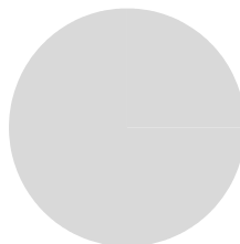
2. Allineamento degli investimenti alla tassonomia escluse le obbligazioni sovrane*

Allineati alla tassonomia: gas fossile 0% Allineati alla tassonomia: nucleare 0% Allineati alla tassonomia (né gas fossile né nucleare) 0% Non allineati alla tassonomia 100%