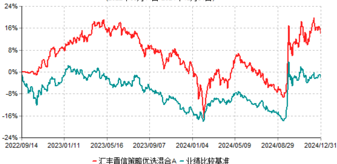
汇丰晋信策略优选混合A累计净值增长率与业绩比较基准收益率历史走势对比图 (2022年09月14日-2024年12月31日)