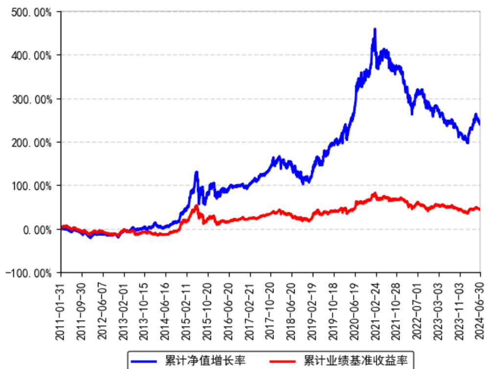
南方优选成长混合A累计净值增长率与同期业绩比较基准收益率的历史走势对比图