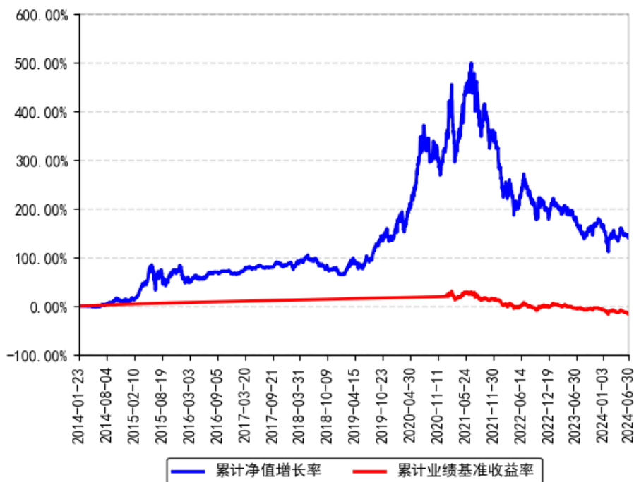
南方医药保健灵活配置混合A累计净值增长率与同期业绩比较基准收益率的历史走势对比图