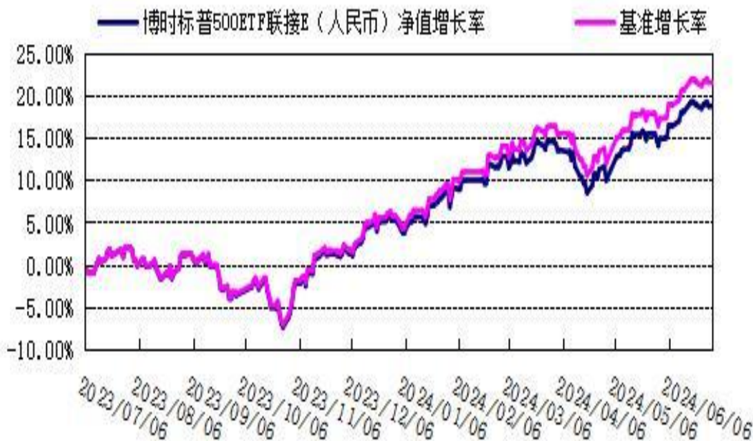
份额累计净值增长率与业绩比较基准收益率的历史走势对比图