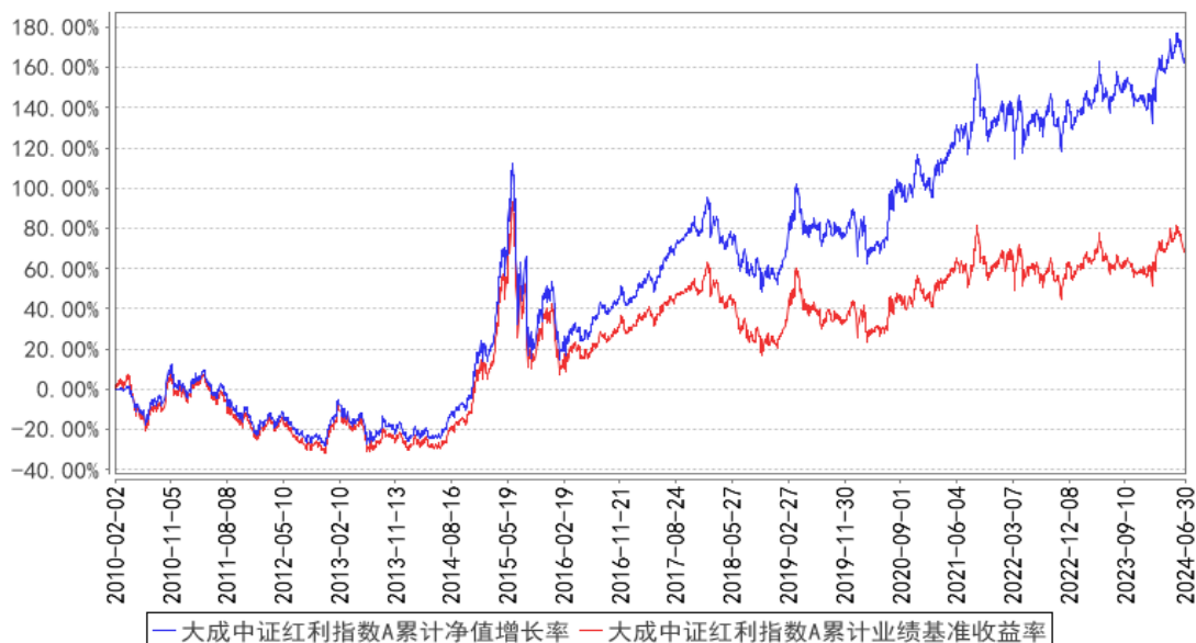
大成中证红利指数A累计净值增长率与同期业绩比较基准收益率的历史走势对比图