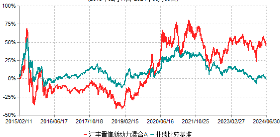
汇丰晋信新动力混合A累计净值增长率与业绩比较基准收益率历史走势对比图 (2015年02月11日-2024年06月30日)

注: 1. 按照基金合同的约定, 本基金的投资组合比例为: 股票资产占基金资产的 50%-95%, 其中投资于新动力主题的股票比例不低于非现金基金资产的 80%, 权证投资占基金资产的 0-3%; 现金、债券资产及中国证监会允许基金投资的其他证券品种占基金资产比例不低于 5%, 现金 (不包括结算备付金、存出保证金、应收申购款等) 或者到期日在一年以内的政府债券不低于基金资产净值 5%。本基金自基金合同生效日起不超过六个月内完成建仓。截止 2015 年 8 月 11 日, 本基金的各项投资比例已达到基金合同约定的比例。 2. 报告期内本基金的业绩比较基准 = 中证 800 指数 (CSI800) * 80% + 银行同业存款利率 * 20%。 3. 上述基金净值增长率的计算已包含本基金所投资股票在报告期产生的股票红利收益。同期业绩比较基准收益率的计算未包含中证 800 指数成份股在报告期产生的股票红利收益。