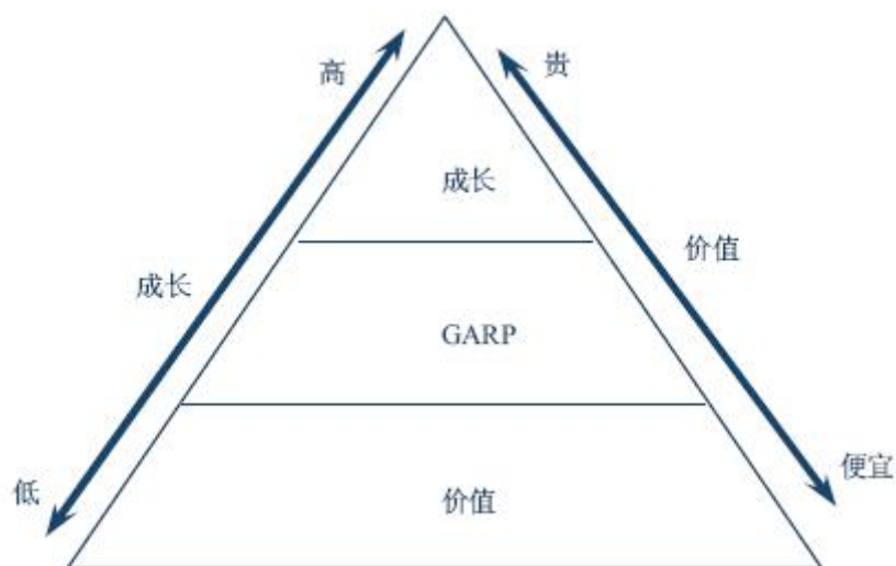
图 1 GARP 投资理念