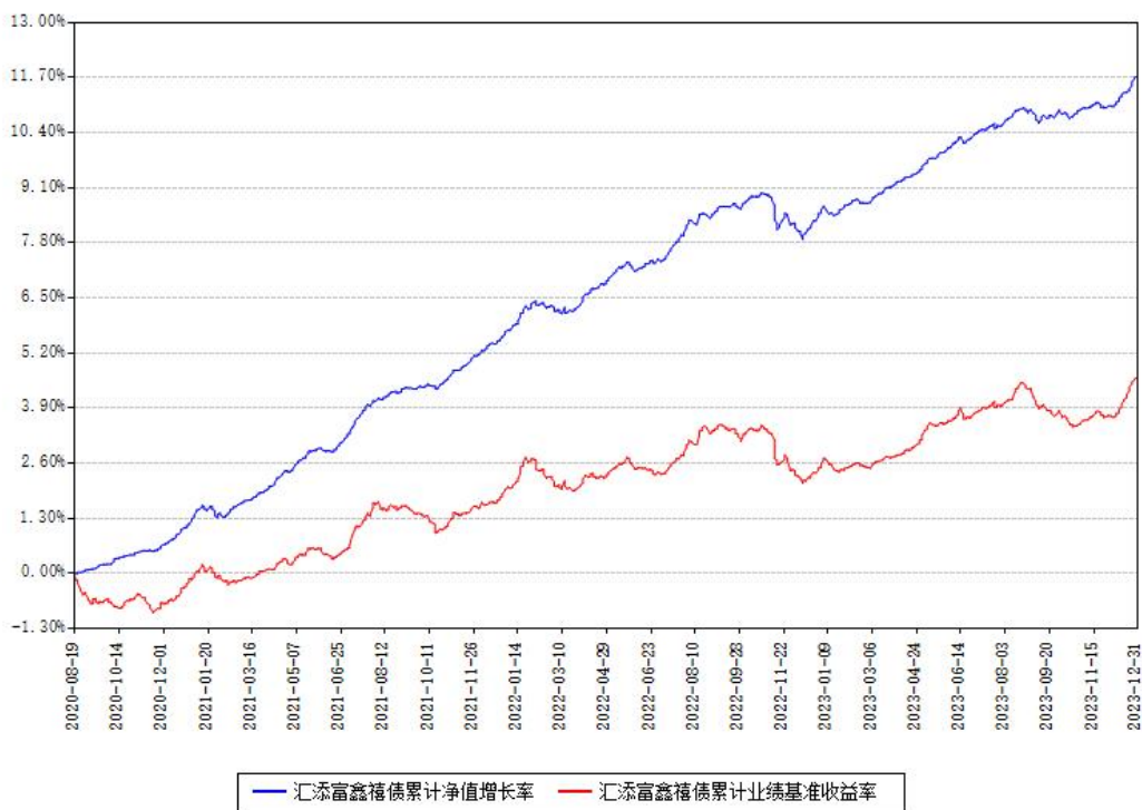
汇添富鑫禧债累计净值增长率与同期业绩基准收益率对比图

注：本基金建仓期为本《基金合同》生效之日（2020年08月19日）起6个月，建仓期结束时各项资产配置比例符合合同约定。