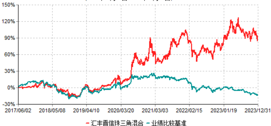
汇丰晋信珠三角区域发展混合型证券投资基金累计净值增长率与业绩比较基准收益率历史走势对比图 (2017年06月02日-2023年12月31日)