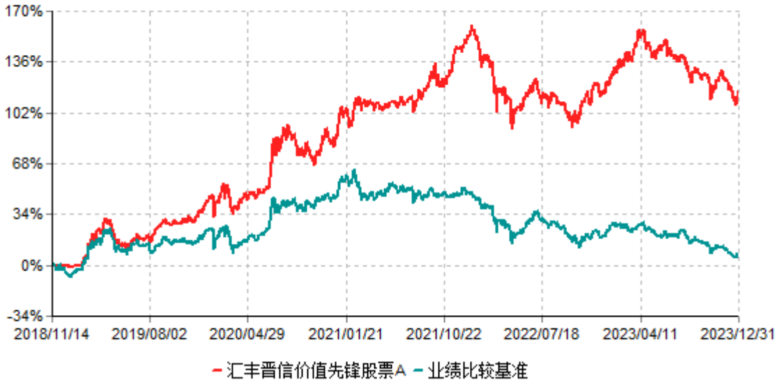
汇丰晋信价值先锋股票A累计净值增长率与业绩比较基准收益率历史走势对比图 (2018年11月14日-2023年12月31日)