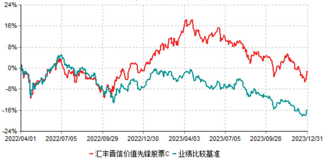
汇丰晋信价值先锋股票C累计净值增长率与业绩比较基准收益率历史走势对比图 (2022年04月01日-2023年12月31日)