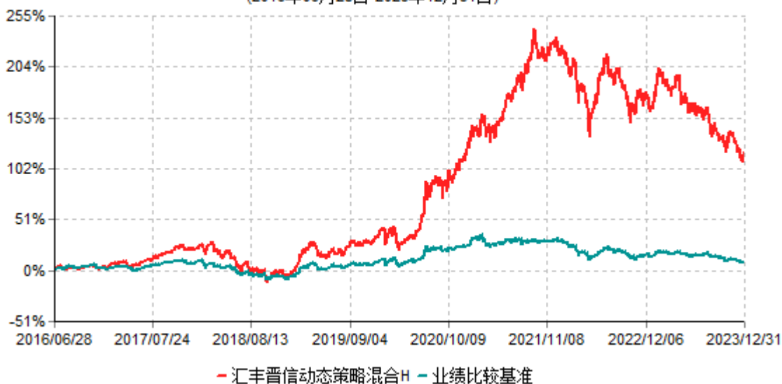
汇丰晋信动态策略混合H累计净值增长率与业绩比较基准收益率历史走势对比图 (2016年06月28日-2023年12月31日)

3. 自 2018 年 3 月 1 日起，MSCI 中国 A 股指数更名为 MSCI 中国 A 股在岸指数。