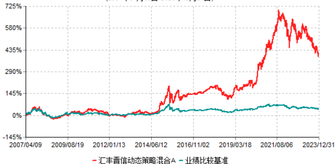
汇丰晋信动态策略混合A累计净值增长率与业绩比较基准收益率历史走势对比图 (2007年04月09日-2023年12月31日)

注：1. 按照基金合同的约定，本基金的投资组合比例为：股票占基金资产的 30%-95%；除股票以外的其他资产占基金资产的 5%-70%，其中现金（不包括结算备付金、存出保证金、应收申购款等）或到期日在一年期以内的政府债券的比例合计不低于基金资产净值的 5%。本基金自基金合同生效日起不超过六个月内完成建仓。截止 2007 年 10 月 9 日，本基金的各项投资比例已达到基金合同约定的比例。