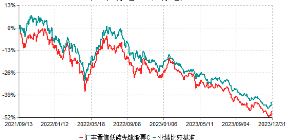
汇丰晋信低碳先锋股票C累计净值增长率与业绩比较基准收益率历史走势对比图 (2021年09月13日-2023年12月31日)