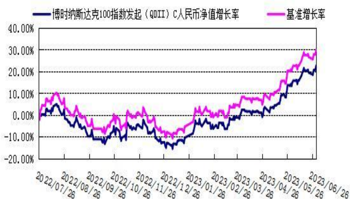
份额累计净值增长率与业绩比较基准收益率的历史走势对比图

注：本基金的基金合同于 2022 年 7 月 26 日生效。按照本基金的基金合同规定，自基金合同生效之日起 6 个月内使基金的投资组合比例符合本基金合同“投资范围”、“投资禁止行为与限制”章节的有关约定。本基金建仓期结束时各项资产配置比例符合基金合同约定。