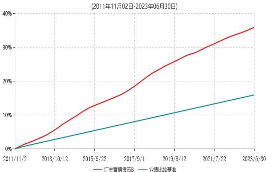
汇丰晋信货币B累计净值收益率与业绩比较基准收益率历史走势对比图