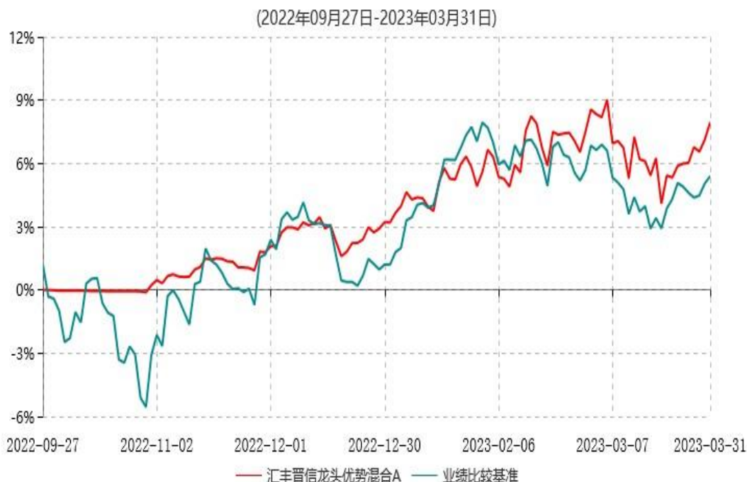
汇丰晋信龙头优势混合A累计净值增长率与业绩比较基准收益率历史走势对比图