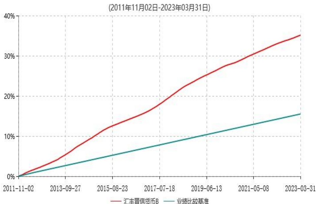
汇丰晋信货币B累计净值收益率与业绩比较基准收益率历史走势对比图