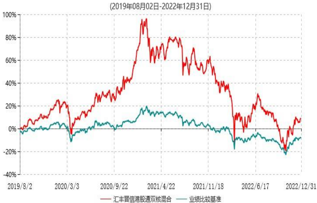
汇丰晋信港股通双核策略混合型证券投资基金累计净值增长率与业绩比较基准收益率历史走势对比图