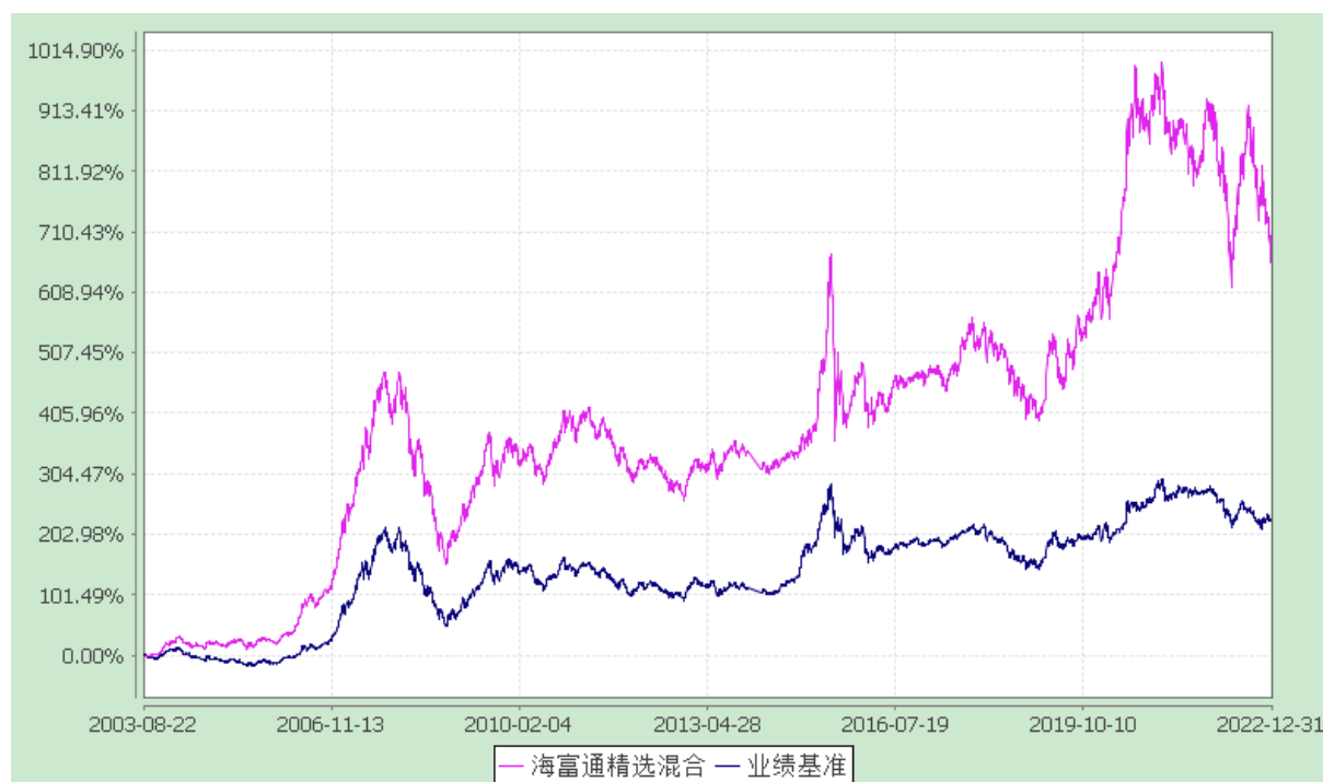
海富通精选证券投资基金 份额累计净值增长率与业绩比较基准收益率的历史走势对比图 (2003 年 8 月 22 日至 2022 年 12 月 31 日)

注：1、按基金合同规定,本基金自基金合同生效起 6 个月内为建仓期。本基金自 2007 年 6 月 28 日至 2007 年 9 月 29 日,为持续营销后建仓期。建仓期满至今,本基金投资组合均达到本基金合同第十八条(三)、(六)规定的比例限制及本基金投资组合的比例范围。 2、为了能更公允地体现基金投资业绩,海富通基金管理有限公司自 2007 年 1 月 1 日起调整海富通精选基金业绩比较基准中股票部分的基准。原比较基准中的上证指数将调整为 MSCI China A 指数,相应的基准权重不变。