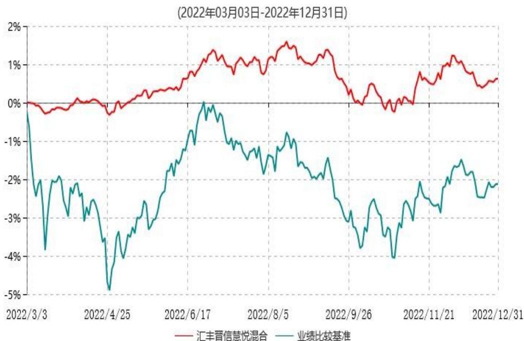
汇丰晋信慧悦混合型证券投资基金累计净值增长率与业绩比较基准收益率历史走势对比图