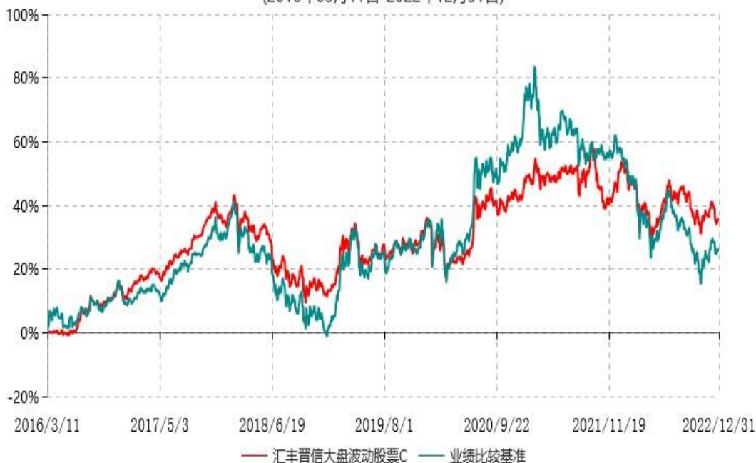
汇丰晋信大盘波动股票C累计净值增长率与业绩比较基准收益率历史走势对比图 (2016年03月11日-2022年12月31日)