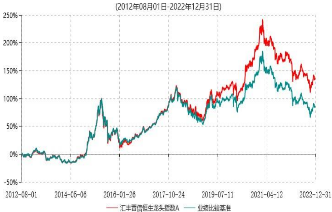
汇丰晋信恒生龙头指数A累计净值增长率与业绩比较基准收益率历史走势对比图