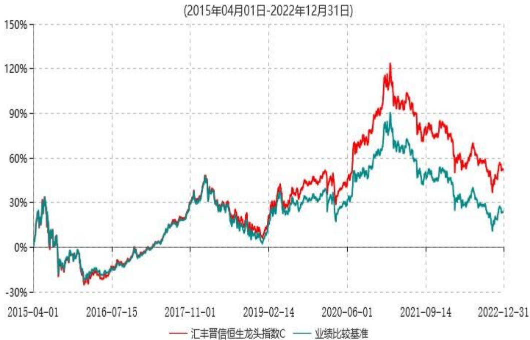
汇丰晋信恒生龙头指数C累计净值增长率与业绩比较基准收益率历史走势对比图