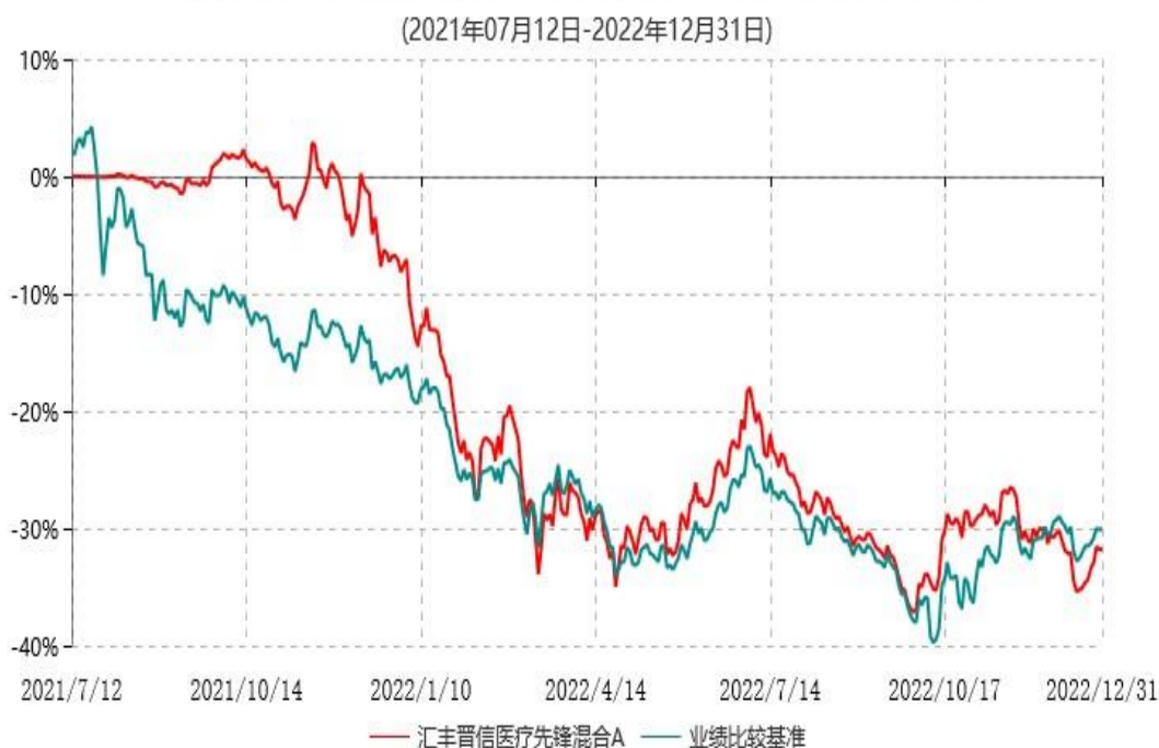
汇丰晋信医疗先锋混合A累计净值增长率与业绩比较基准收益率历史走势对比图