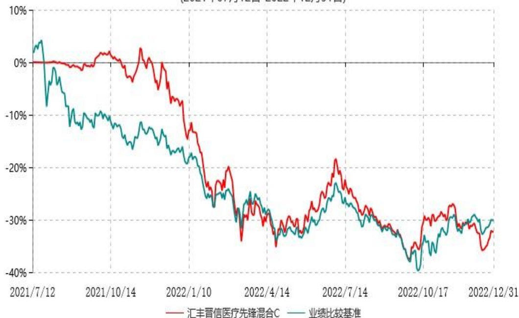
汇丰晋信医疗先锋混合C累计净值增长率与业绩比较基准收益率历史走势对比图 (2021年07月12日-2022年12月31日)