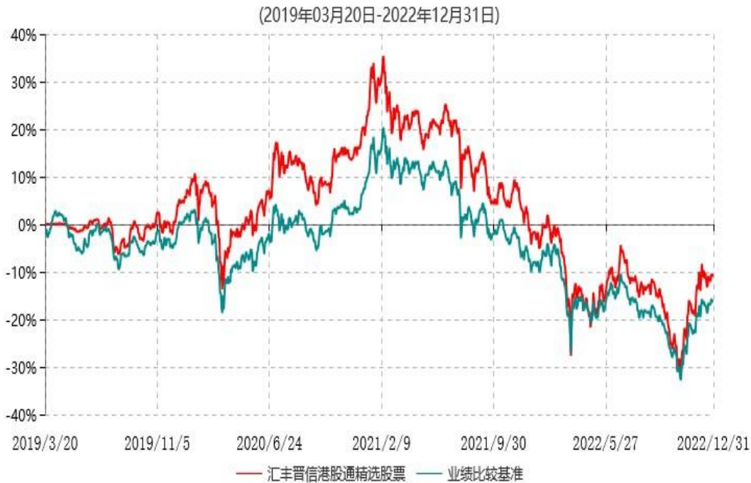
汇丰晋信港股通精选股票型证券投资基金累计净值增长率与业绩比较基准收益率历史走势对比图