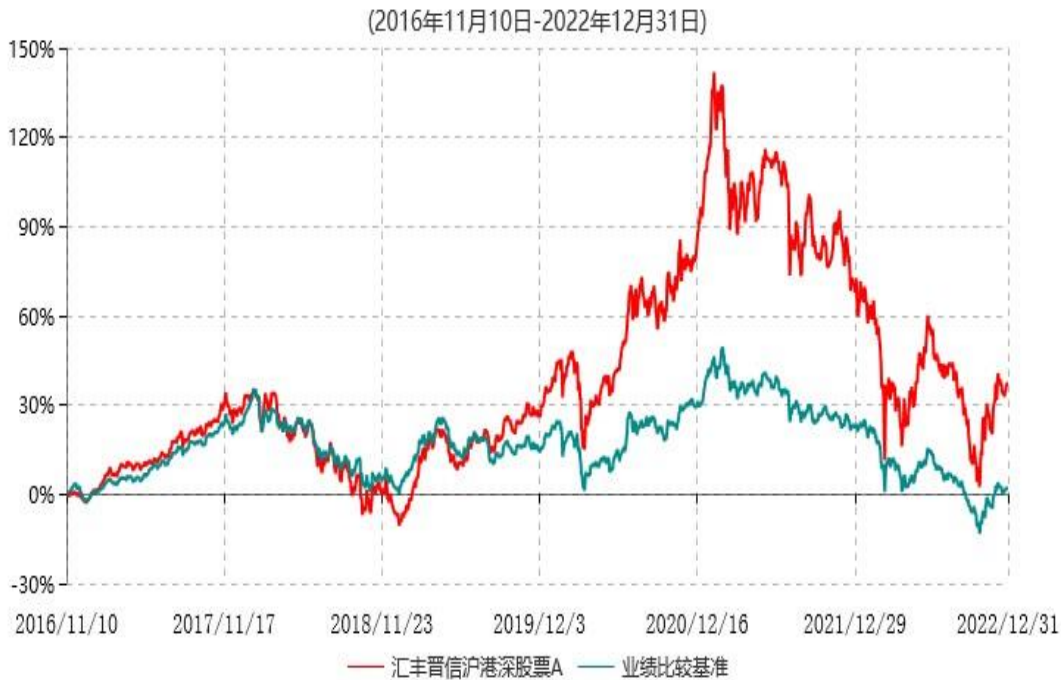
汇丰晋信沪港深股票A累计净值增长率与业绩比较基准收益率历史走势对比图

注：1.按照基金合同的约定，本基金的投资组合比例为：股票资产占基金资产的80%-95%（投资于港股通标的股票的比例占基金资产的0-95%），投资于权证的比例为基金资产净值的0-3%，现金或者到期日在一年以内的政府债券不低于基金资产净值5%，其中，现金不包括结算备付金、存出保证金、应收申购款等。本基金依据法律法规的规定，本着谨慎和风险可控的原则，可参与创业板上市证券的投资。