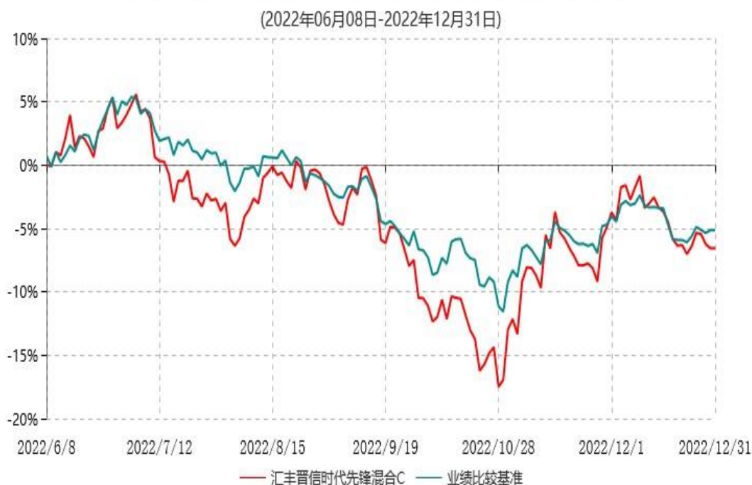
汇丰晋信时代先锋混合C累计净值增长率与业绩比较基准收益率历史走势对比图