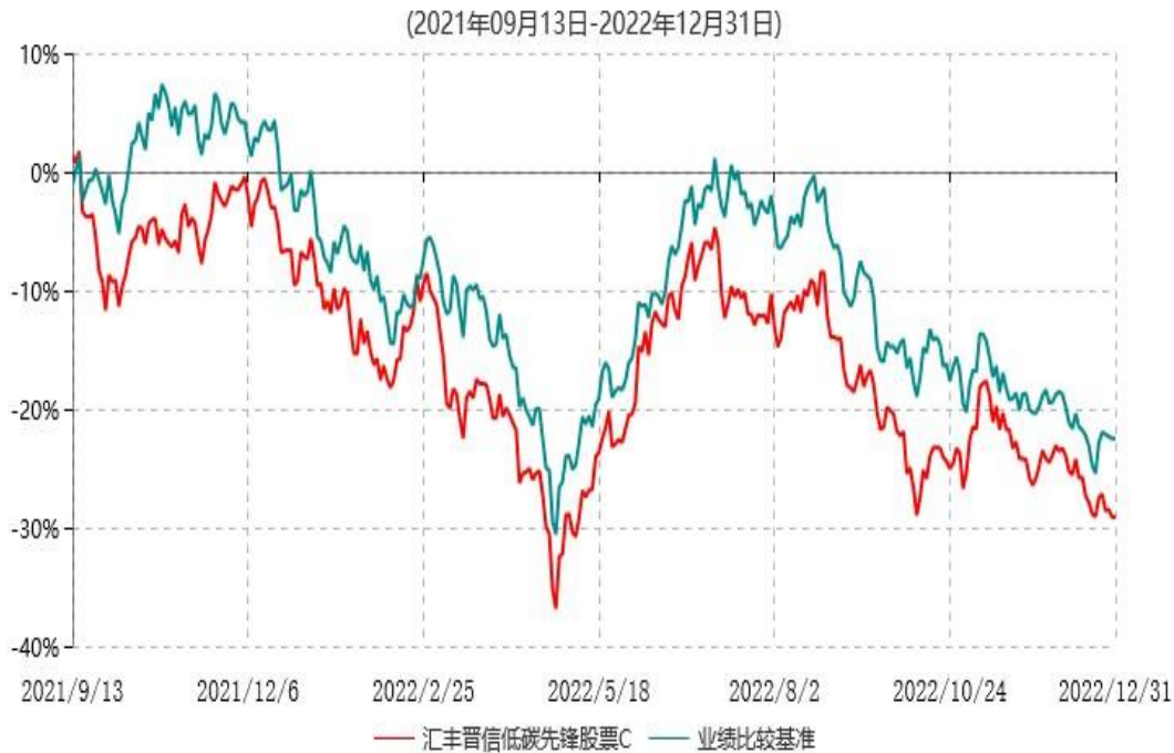
汇丰晋信低碳先锋股票C累计净值增长率与业绩比较基准收益率历史走势对比图