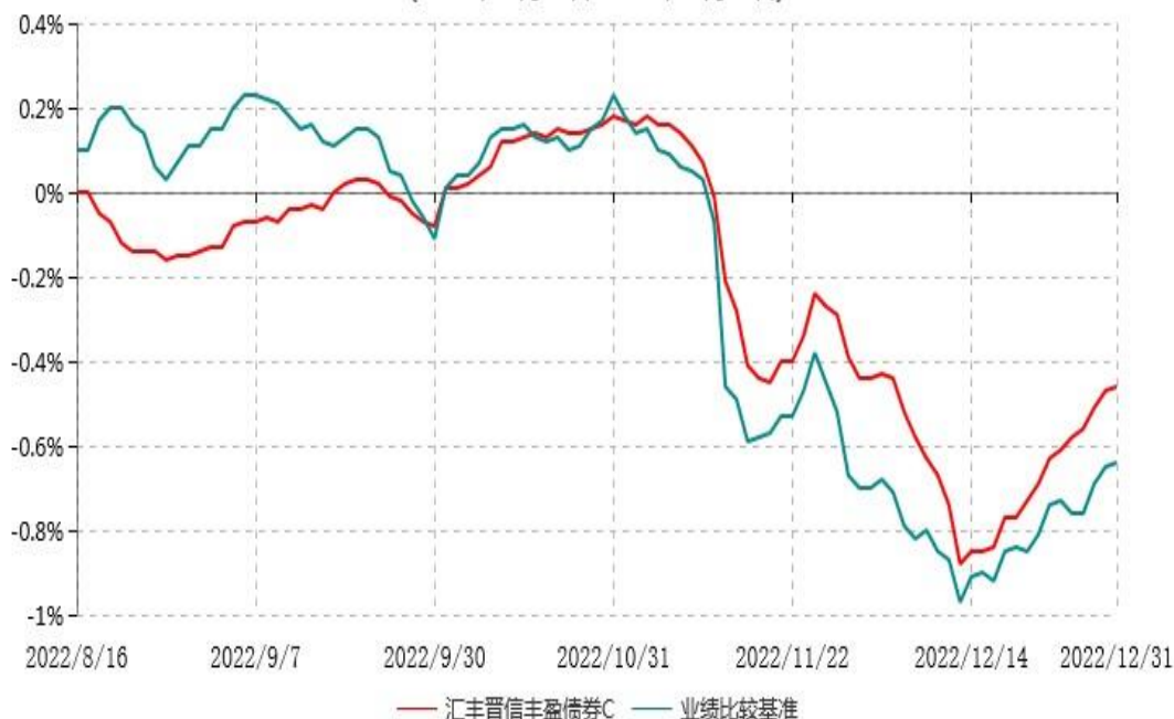
汇丰晋信丰盈债券C累计净值增长率与业绩比较基准收益率历史走势对比图 (2022年08月16日-2022年12月31日)