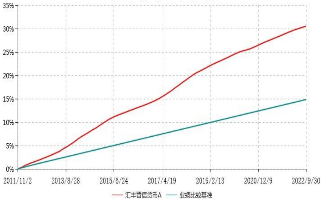
汇丰晋信货币A累计净值收益率与业绩比较基准收益率历史走势对比图 (2011年11月02日-2022年09月30日)