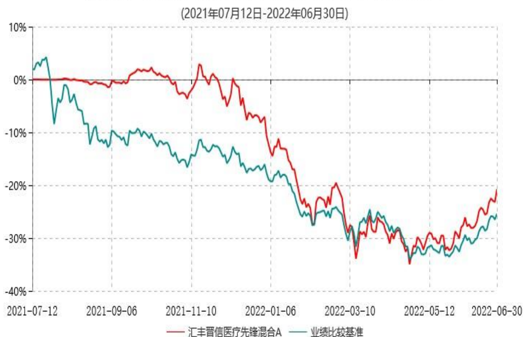
汇丰晋信医疗先锋混合A累计净值增长率与业绩比较基准收益率历史走势对比图