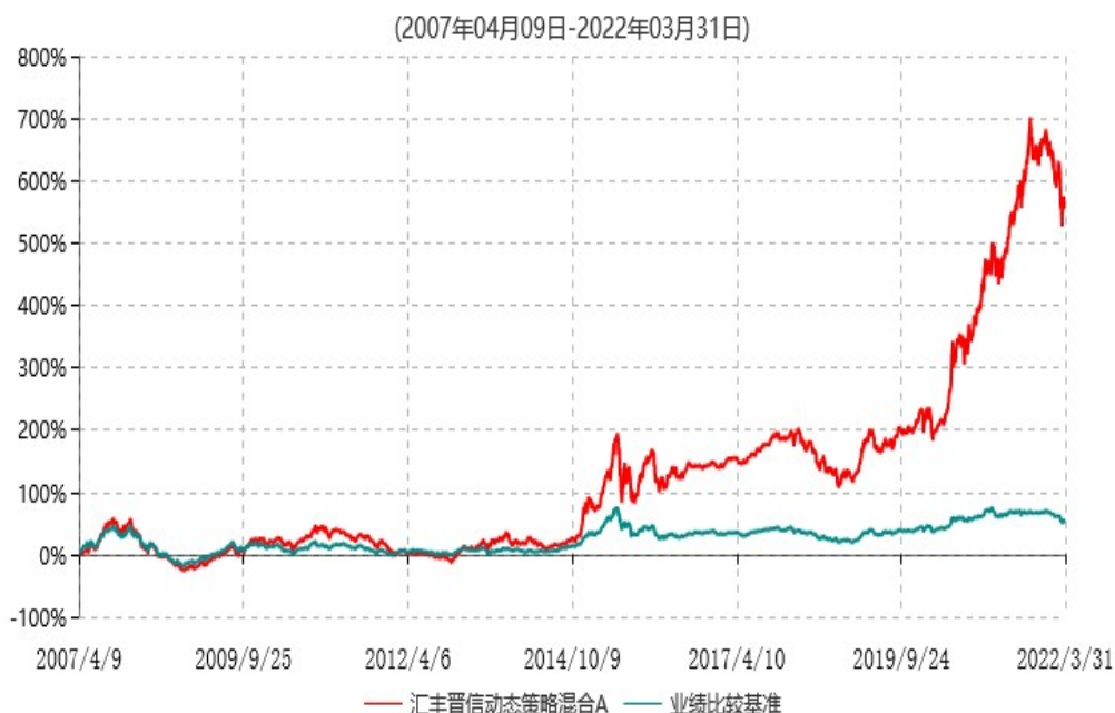
汇丰晋信动态策略混合A累计净值增长率与业绩比较基准收益率历史走势对比图

注：1. 按照基金合同的约定，本基金的投资组合比例为：股票占基金资产的 30%-95%；除股票以外的其他资产占基金资产的 5%-70%，其中现金（不包括结算备付金、存出保证金、应收申购款等）或到期日在一年期以内的政府债券的比例合计不低于基金资产净值的 5%。本基金自基金合同生效日起不超过六个月内完成建仓。截止 2007 年 10 月 9 日，本基金的各项投资比例已达到基金合同约定的比例。