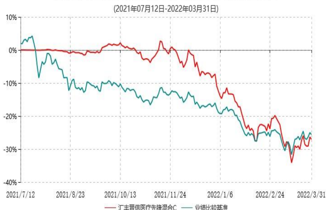
汇丰晋信医疗先锋混合C累计净值增长率与业绩比较基准收益率历史走势对比图

5、上述基金净值增长率的计算已包含本基金所投资股票在报告期产生的股票红利收益。同期业绩比较基准收益率的计算未包含中证医药卫生指数、恒生医疗保健指数成份股在报告期产生的股票红利收益。本基金业绩比较基准中的中债新综合全价指数为中债新综合全价（总值）指数收益率，是以债券全价计算的指数值，债券付息后利息不再计入指数之中。