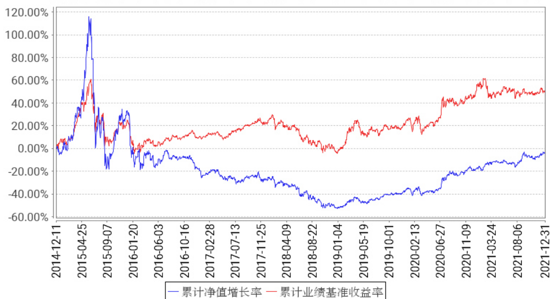
工银创新动力股票累计净值增长率与同期业绩比较基准收益率的历史走势对比图