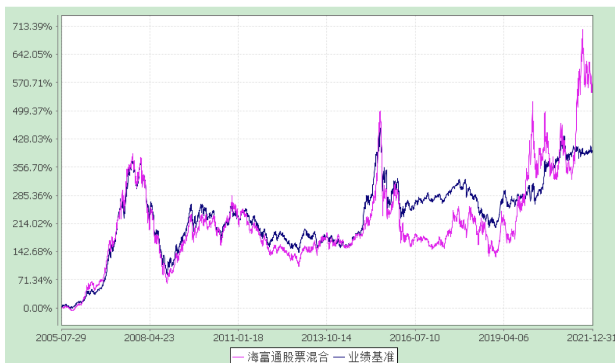
海富通股票混合型证券投资基金 份额累计净值增长率与业绩比较基准收益率的历史走势对比图 (2005 年 7 月 29 日至 2021 年 12 月 31 日)

注：1、按基金合同规定，本基金自基金合同生效起 6 个月内为建仓期。本基金自 2007 年 8 月 22 日至 2007 年 11 月 23 日为持续营销后建仓期。建仓期满至今本基金的各项投资比例已达到基金合同第 14 章（二）关于投资范围的规定；同时满足第 14 章（七）有关投资组合限制的各项比例要求。