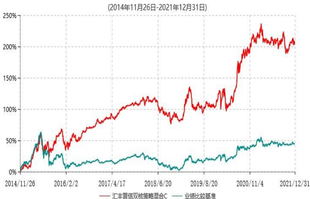
汇丰晋信双核策略混合C累计净值增长率与业绩比较基准收益率历史走势对比图