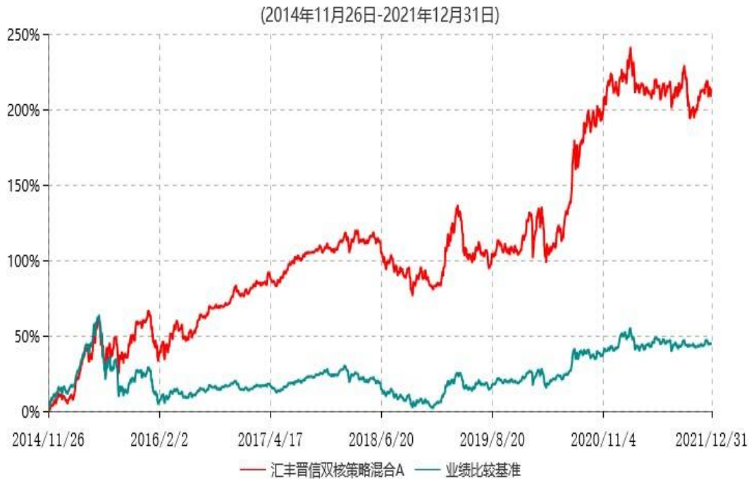
汇丰晋信双核策略混合A累计净值增长率与业绩比较基准收益率历史走势对比图