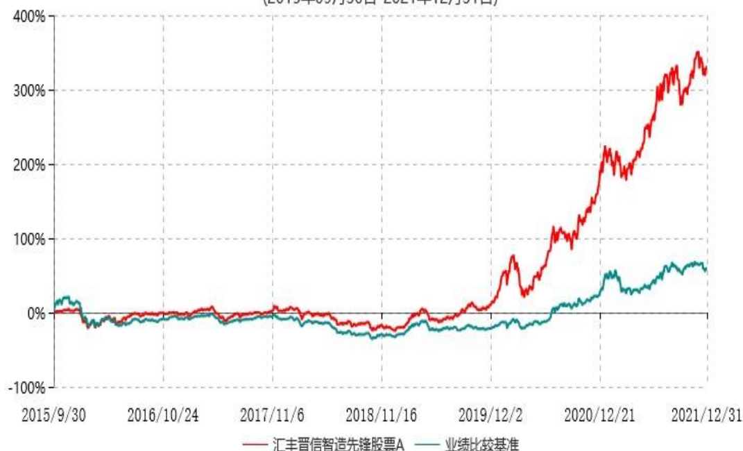
汇丰晋信智造先锋股票A累计净值增长率与业绩比较基准收益率历史走势对比图 (2015年09月30日-2021年12月31日)