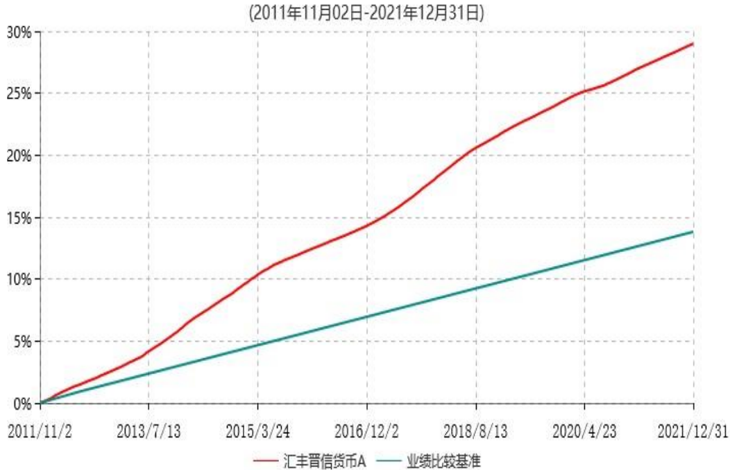
汇丰晋信货币A累计净值收益率与业绩比较基准收益率历史走势对比图