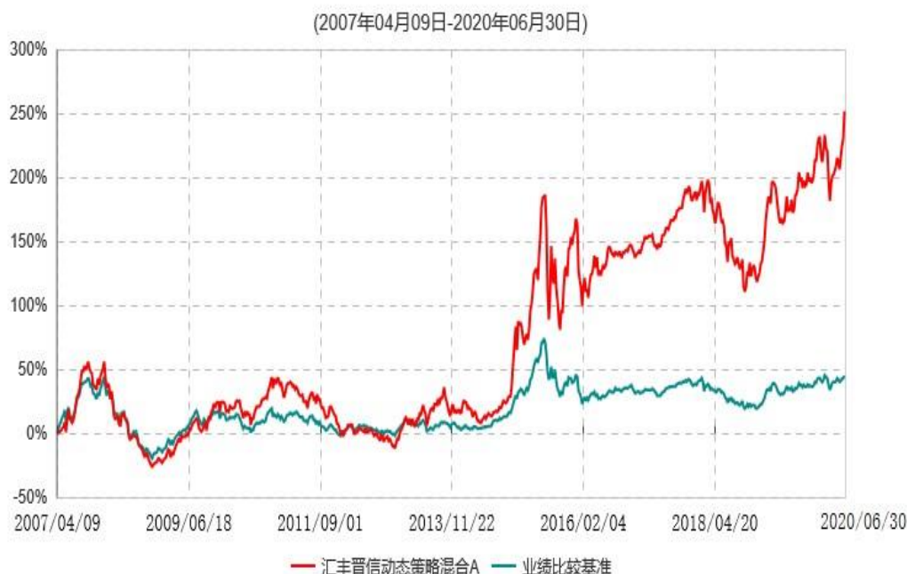
汇丰晋信动态策略混合A累计净值增长率与业绩比较基准收益率历史走势对比图

注：1. 按照基金合同的约定，本基金的投资组合比例为：股票占基金资产的 30%–95%；除股票以外的其他资产占基金资产的 5%–70%，其中现金（不包括结算备付金、存出保证金、应收申购款等）或到期日在一年期以内的政府债券的比例合计不低于基金资产净值的 5%。本基金自基金合同生效日起不超过六个月内完成建仓。截止 2007 年 10 月 9 日，本基金的各项投资比例已达到基金合同约定的比例。