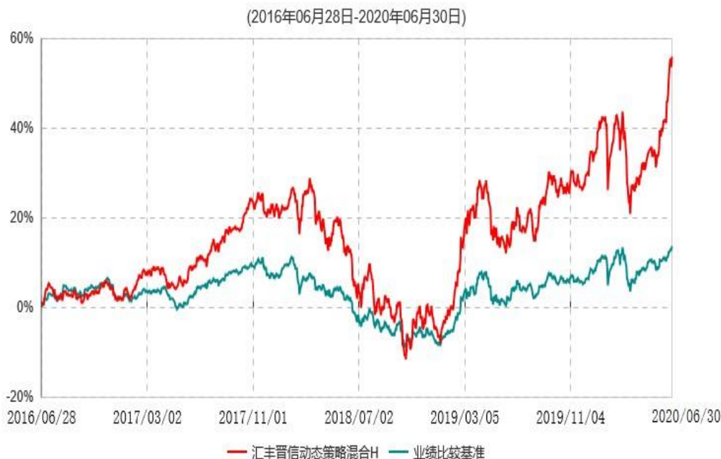
汇丰晋信动态策略混合H累计净值增长率与业绩比较基准收益率历史走势对比图

注：1. 按照基金合同的约定，本基金的投资组合比例为：股票占基金资产的 30%-95%；除股票以外的其他资产占基金资产的 5%-70%，其中现金（不包括结算备付金、存出保证金、应收申购款等）或到期日在一年期以内的政府债券的比例合计不低于基金资产净值的 5%。