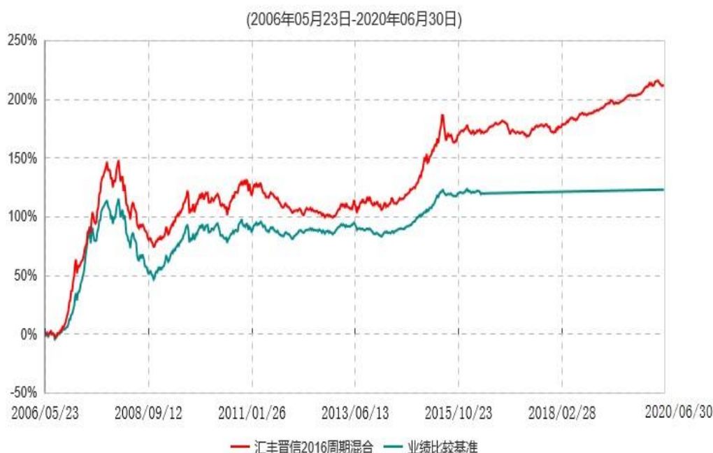
汇丰晋信2016生命周期开放式证券投资基金累计净值增长率与业绩比较基准收益率历史走势对比图