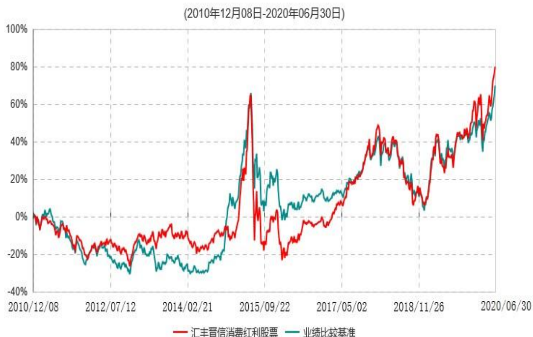
汇丰晋信消费红利股票型证券投资基金累计净值增长率与业绩比较基准收益率历史走势对比图

注：1.按照基金合同的约定，本基金的投资组合比例为：股票投资比例范围为基金资产的85%-95%，权证投资比例范围为基金资产净值的0%-3%。固定收益类证券、现金和其他资产投资比例范围为基金资产的5%-15%，其中现金（不包括结算备付金、存出保证金、应收申购款等）或到期日在一年以内的政府债券的投资比例不低于基金资产净值的5%。按照基金合同的约定，本基金自基金合同生效日起不超过6个月内完成建仓，截止2011年6月8日，本基金的各项投资比例已达到基金合同约定的比例。