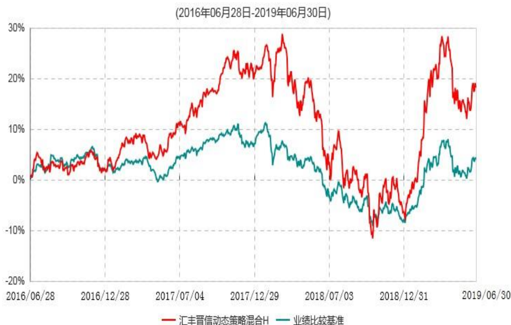
汇丰晋信动态策略混合H累计净值增长率与业绩比较基准收益率历史走势对比图