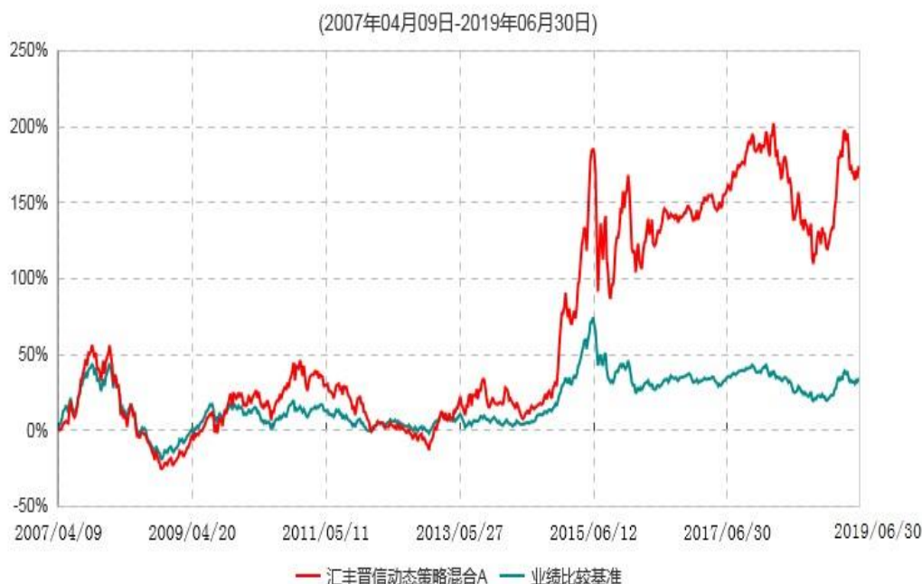
汇丰晋信动态策略混合A累计净值增长率与业绩比较基准收益率历史走势对比图