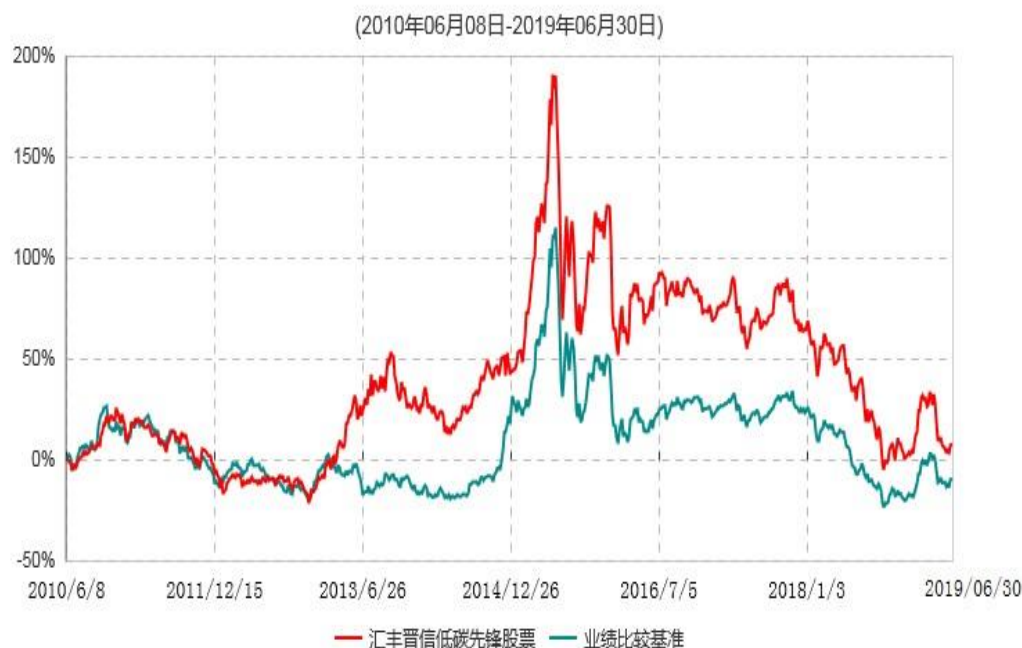
汇丰晋信低碳先锋股票型证券投资基金累计净值增长率与业绩比较基准收益率历史走势对比图